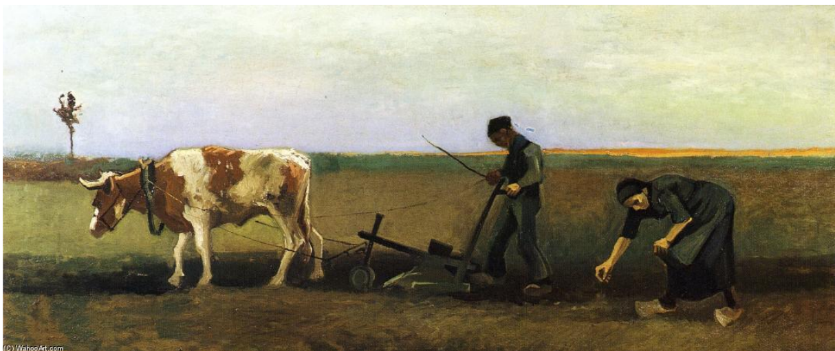
Le laboureur Van Gogh 1884. V d Heydt Museum.