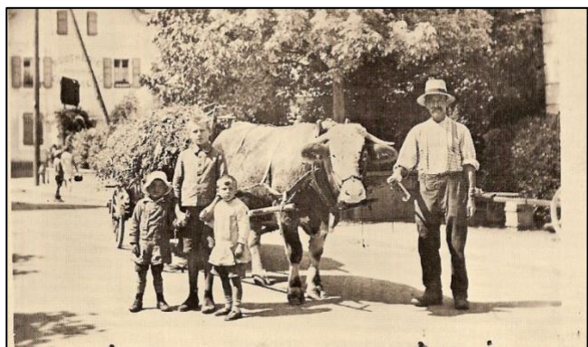
Attelage de vache, XXe siècle.