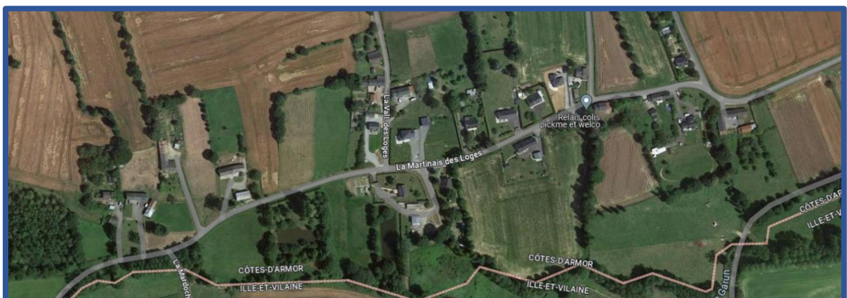
La Madochère, 2023.